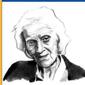
Dorothy Crowfoot Hodgkin (1910-1994) ● 1964 G.B.

Física d'origen alemany, va treballar en el context dels nous descobriments de partícules, les reaccions atòmiques i els primers acceleradors. Amb el seu marit, Joseph Mayer, es va traslladar als Estats Units. A partir de la gran crisi econòmica de 1929 va passar els seus anys més productius treballant voluntàriament a la docència i a la investigació.