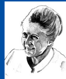
Shirin Ebadi (1947) ● 2003 Iran

Diplomàtica sueca. Ha lluitat contra l'armamentisme i a favor dels drets humans i la pau. Des de 1962 va representar el seu país en les conferències de desarmament de l'ONU. Ha escrit El joc del desarmament , en què mostra la seva decepció davant l'actitud dels Estats Units i l'URSS. Va fundar l'Institut d'Investigació per a la Pau a Estocolm.