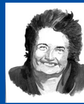
Mairead Corrigan-Maguirre (1944) ● 1976 G.B.

Pacifista. Nascuda a Belfast, pertany a la comunitat catòlica d'Irlanda del Nord. Cofundadora de la Comunitat de la Gent de Pau, moviment pacifista de dones format per catòliques i protestants amb la finalitat d'acabar amb la violència a Irlanda del Nord. Actualment, treballa amb altres premis Nobel en un programa de l'ONU.