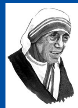
Mare Teresa de Calcuta (1910-1997) ● 1979 Índia

Sociòloga i reformadora social. Amb una amiga fundà a Chicago la Hull House, que es convertí en el primer centre d'assistència social als Estats Units. Hi cuidaven nens i malalts. A més, tenien escola nocturna, borsa de treball, menjador públic, gimnàs... Va lluitar a favor dels drets de les dones, els negres i els immigrants i en contra de l'entrada del seu país a la guerra. Va presidir l'Associació Femenina Internacional per a la Pau i la Llibertat.