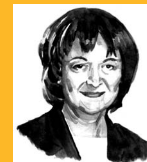
Linda B. Buck (1947) ● 2004 EE.UU

Metgessa. Amb l'investigador Richard Axel ha compartit el premi Nobel pels descobriments sobre el sistema olfactiv. L'any 1991, van presentar un treball conjunt en el que descrivien una gran família d'un miler de gens (3% dels gens humans) que donen lloc a un nombre equivalent de receptors olfactivs. Aquest treball mostra els principis bàsics que regeixen el reconeixement i la memòria olfactiva de prop de 10.000 olors diferents.