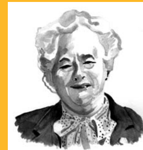
Gertrude Elion (1918-1999) ● 1988 EE.UU

Química. Va treballar en el desenvolupament de fàrmacs que interrompen el cicle reproductiu de les cèl·lules anormals sense alterar les sanes. Els seus medicaments van fer possible el trasplantament d'òrgans, la reducció de la mortalitat a causa de la leucèmia infantil o el descobriment de l'AZT, que, durant anys, va ser l'únic tractament per combatre la sida.