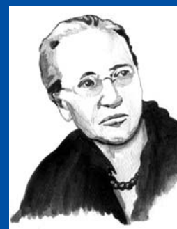
Alva Reimer Myrdal (1902-1986) ● 1982 Suècia

Sociòloga i economista. Defensora del dret de vot per a les dones, va treballar activament contra la segregació racial i el treball infantil. Amb motiu de la I Guerra Mundial va entrar en contacte amb la causa pacifista. Va ser presidenta de la Lliga Internacional Femenina per la Pau i la Llibertat amb seu a Ginebra.